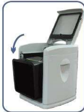
Le mélangeur rotatif aide à expulser le compost