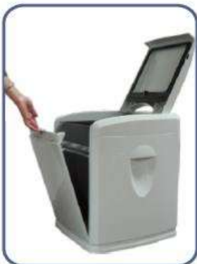
Ouvrez le couvercle supérieur et le couvercle frontal