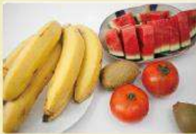
Déchets de peaux de fruits

Attention : assurez vous que la taille des déchets alimentaire est inférieure à 5 cm avant de les insérer dans le composteur.