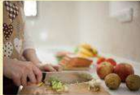
Tiges de légumes